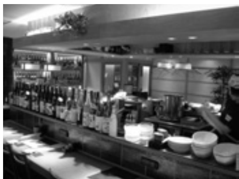
青山通り沿いのビル地下に立地。PA20人を擁して、シフトは昼、夜、通しの3時間帯で回している