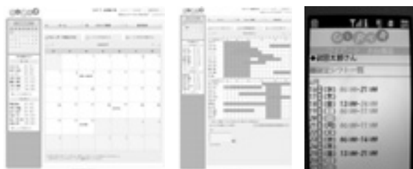
店舗に設置されたパソコンと、PAの携帯電話を使用したシフト簡易作成サービス「シフター」。07年暮れからテストサービスを開始し、外食業界を中心に多業種での展開を進める。申請即日のサービス利用開始も可能だ

R（シフター）だ。使用する機器はインターネットに接続したパソコンと、各PAの携帯電話だけ。新たな機器購入やパソコンに専用ソフトをインストールするといった手間はいつさいない。その上、料金は年間契約（一括支払）の場合49800円。月額に換算すると4150円という低料金だから、投資コストはきわめて低い。契約すると各店には専用ページが設けられ、シフト作成者はその専用ページにインターネットでアクセスし、PAの名前と携帯電話のメールアドレスを登録。PAは携帯電話から希望シフトを入力して提出締切日までに専用ページに送信する。すると専用ページのシフト表にPAの希望シフトが表示される。設定した必要人員数との過不足は色分けで表示されるので、後は簡単な操作でシフト表を作成するだけである。ちなみにこの作業はインターネットに接続できるのならば、自宅のパソコンで行なうことも可能である。そしてPAは携帯電話で完成したシフトを確認する、といった流れだ。