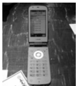
シフト表の提出や確認は携帯電話から。操作がシンプルなので、中高年のPAでもすぐに覚えられます

R（シフター）だ。使用する機器はインターネットに接続したパソコンと、各PAの携帯電話だけ。新たな機器購入やパソコンに専用ソフトをインストールするといった手間はいつさいない。その上、料金は年間契約（一括支払）の場合49800円。月額に換算すると4150円という低料金だから、投資コストはきわめて低い。契約すると各店には専用ページが設けられ、シフト作成者はその専用ページにインターネットでアクセスし、PAの名前と携帯電話のメールアドレスを登録。PAは携帯電話から希望シフトを入力して提出締切日までに専用ページに送信する。すると専用ページのシフト表にPAの希望シフトが表示される。設定した必要人員数との過不足は色分けで表示されるので、後は簡単な操作でシフト表を作成するだけである。ちなみにこの作業はインターネットに接続できるのならば、自宅のパソコンで行なうことも可能である。そしてPAは携帯電話で完成したシフトを確認する、といった流れだ。